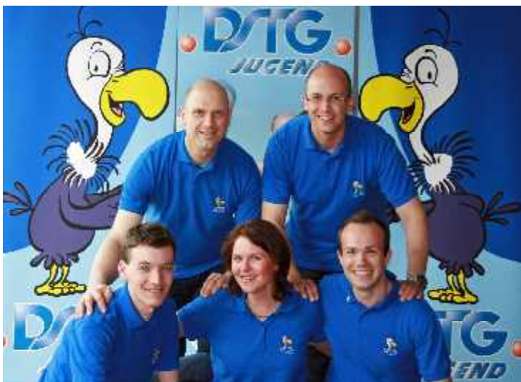
Die aktuelle Bundesjugendleitung (v. l.):