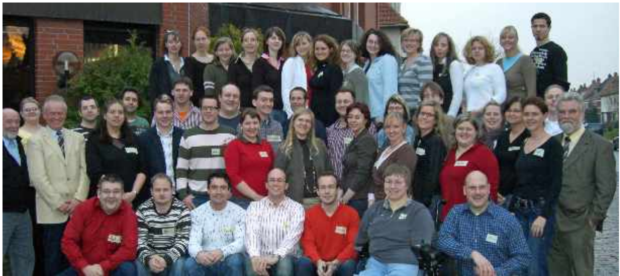
Die Mitglieder des Bundesjugendausschusses mit Gästen am Rande der Sitzung in Oldenburg

Soweit es zeitlich möglich war, wurden bei den Sitzungen des Bundesjugendausschusses jeweils mehrere Arbeitsgruppen gebildet, die durch die Behandlung diverser Themen den Austausch unter den Mitgliedsverbänden über die Diskussionen zu den einzelnen Tagesordnungspunkten hinaus erheblich förderten.