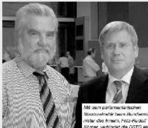
Mit dem parlamentarischen Staatssekretär beim Bundesminister des Inneren, Fritz-Rudolf Körper, verbindet die DSTG eine lange Freundschaft.

Der Parlamentarische Staatssekretär beim Bundesminister des Inneren, Fritz-Rudolf Körper, referierte zum neuen Dienstrecht und der Bedeutung von