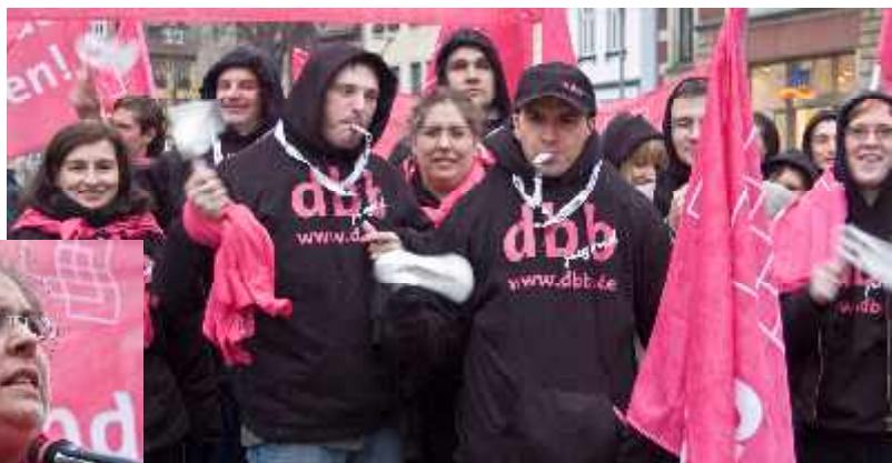
oben: die dbb jugend geht auf die Straße