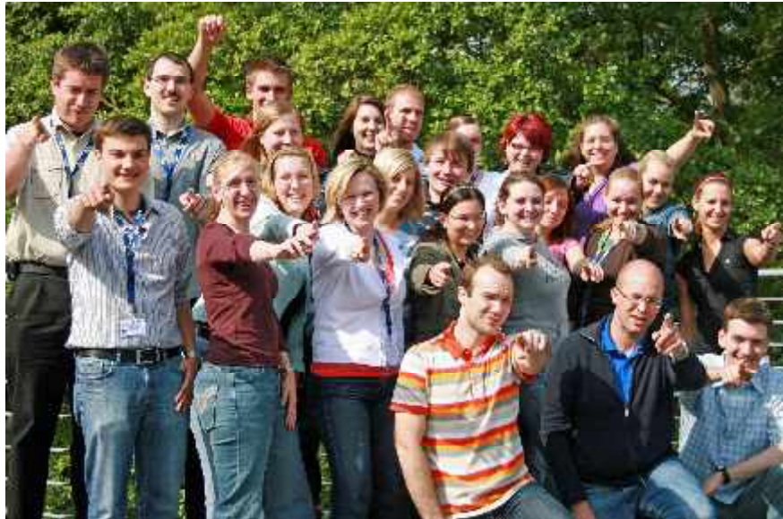
Klausurtagung 2008: Teilnehmer und Arbeitskreis Ausbildung

Die Auswertung der Klausurtagung wurde u. a. den obersten Finanzbehörden der Bundesländer sowie den Teilnehmern zur Verfügung gestellt. Sie floss in eine Vorlage des AK Ausbildung an den Bundesjugendausschuss ein und mündete in einen Leitantag zum Bundesjugendtag 2009 der DSTG-Jugend.