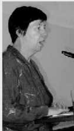
Die parlamentarische Staatssekretärin beim Bundesminister der Finanzen, Dr. Barbara Hendricks, ließ es sich trotz Termindruck nicht nehmen, beim Fortbildungskongress der DSTG zu referieren.

Die Parlamentarische Staatssekretärin bei dem Bundesminister für Finanzen, Dr. Barbara Hendricks, unterstrich in ihrem Vortrag die fundamentale Bedeutung der Fortbildung im öffentlichen Dienst. Es sei notwendig, das in der Ausbildung erlangte Wissen kontinuierlich auf den neuesten Stand zu